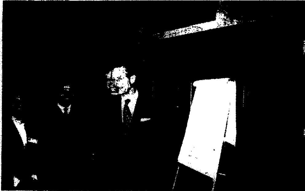
مع الأمير فيليب زوج ملكة بريطانيا